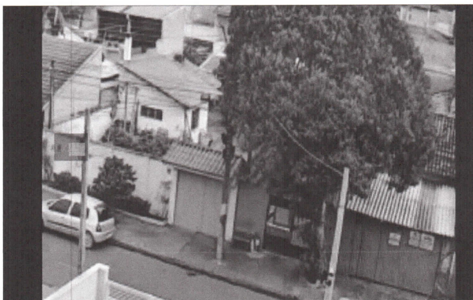
Rua Mabito Shoji, nº 335, Bairro Cidade de Salvador.