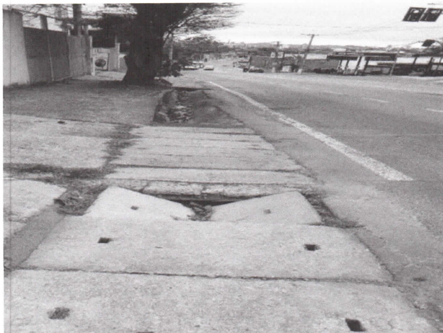
Rodovia Geraldo Scavone, próximo ao número 608, no Jardim Califórnia.

Requerimento nº 463/2025 - Vereador Hernani Barreto - fls. 2/2