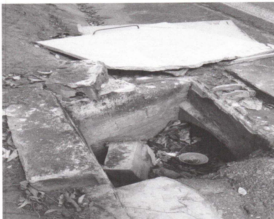
Rodovia Nilo Máximo, entre o km 9 e 10, sentido Município de Jacareí.