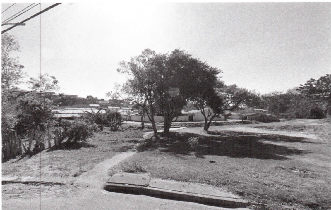
Imagem 2 - condição atual da passagem (2025):

Imagem 1 - passagem de pedestre existente (2023):