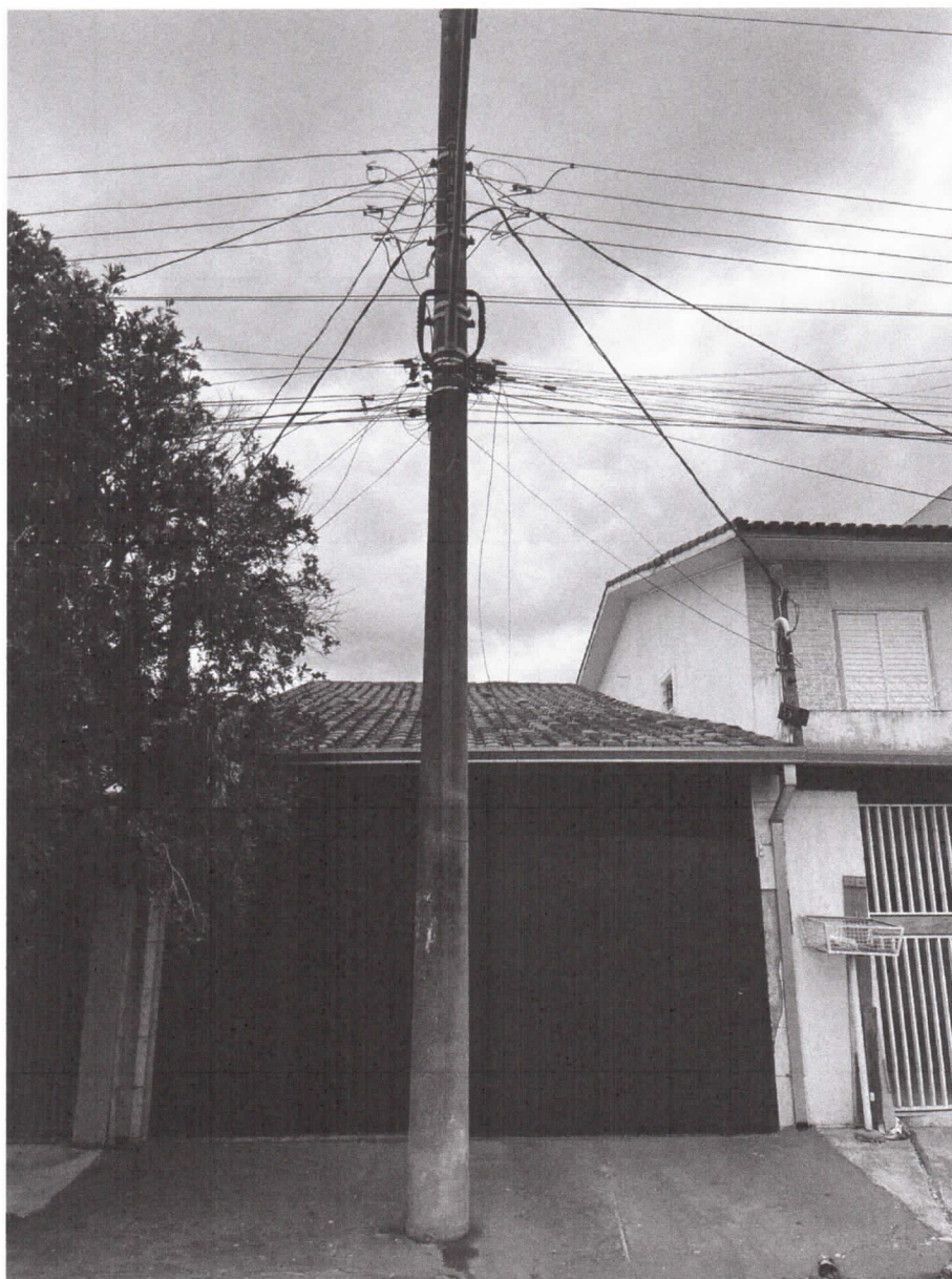
Residência do munícipe.

Indicação nº 4824/2025 - Vereador Luís Flávio (Flavinho) - fls. 3/3