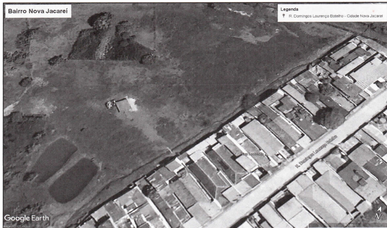
Valeta da rua Domingos Lourenço Botelho - Nova Jacareí