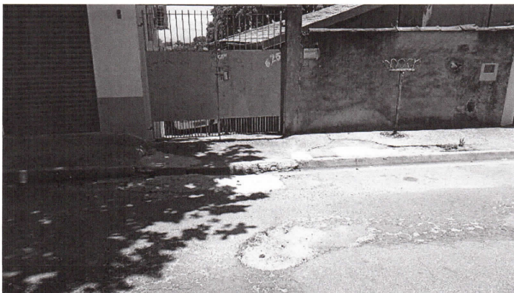
Rua Giancarlo Manetti - Jardim Novo Amanhecer