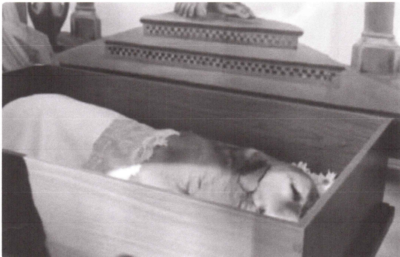
Velório do cão Joca, que morreu em um voo aéreo em 2024; caso ganhou repercussão na época

18/12/2025 08h36 · Atualizado há 3 semanas