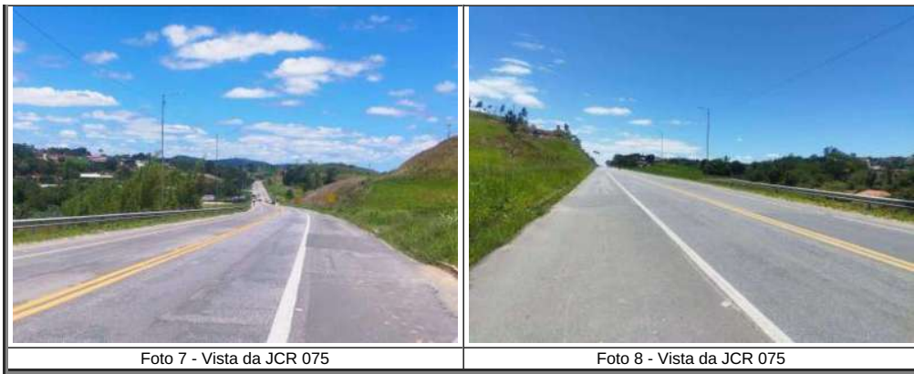
Foto 7 - Vista da JCR 075