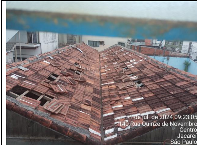
Foto 11: Telhado está muito ruim, com falta de telhas e o madeiramento de sustentação, bastante comprometido;