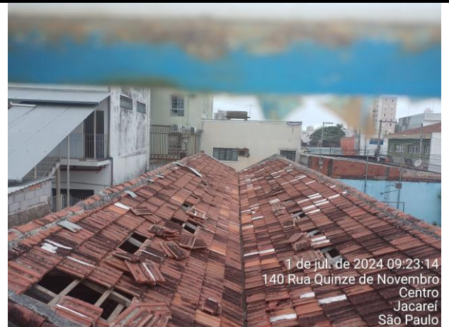
Foto 12: Foto feita a partir do interior de uma das salas do colégio;