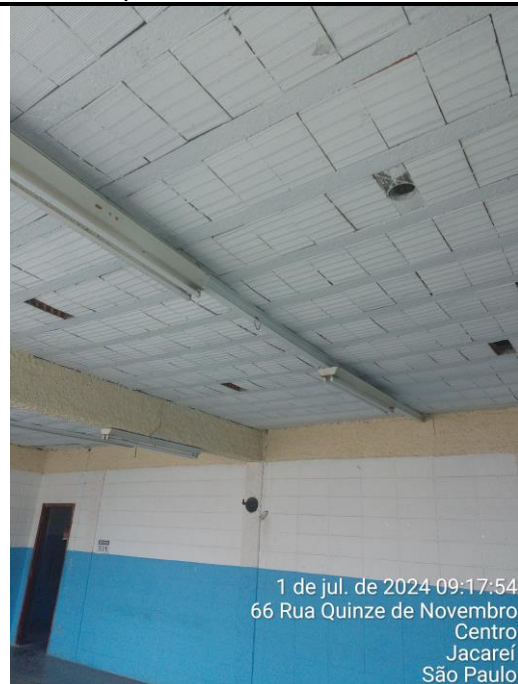
Foto 09: Para minimizar o efeito da deformação na laje, foram instaladas vigas metálicas, visando estancar o processo da formação de flecha nas vigotas das lajes;

Foto 10: Todas as salas que possui apenas uma viga de concreto armada apresentaram o efeito flecha nas vigotas das lajes;