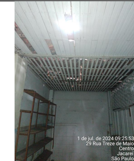
Foto 14: Outro lado da mesma sala, com diversos problemas de conservação;