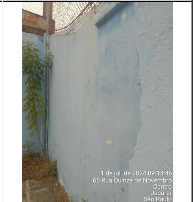
Foto 05: Apesar da rachadura e da umidade, o muro permanece em perfeitas condições de nivelamento e estabilidade;