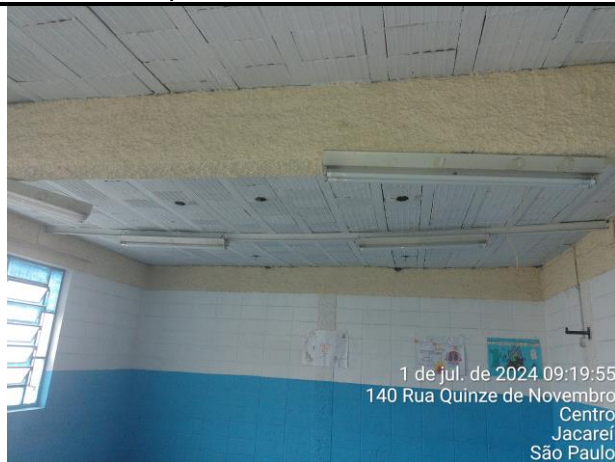
Foto 08: Salas 7 e 8 apresentam deformação significativa da laje, porém, sem apresentar risco de colapso;

Foto 07: frequente falta de manutenção e de conservação resulta em problemas acarretados pelo abandono;