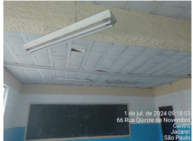
Foto 07: frequente falta de manutenção e de conservação resulta em problemas acarretados pelo abandono;

Foto 08: Salas 7 e 8 apresentam deformação significativa da laje, porém, sem apresentar risco de colapso;