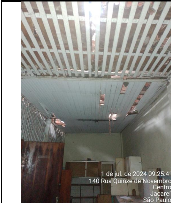
Foto 13: Forração da sala cujo telhado também está em péssimas condições de conservação;