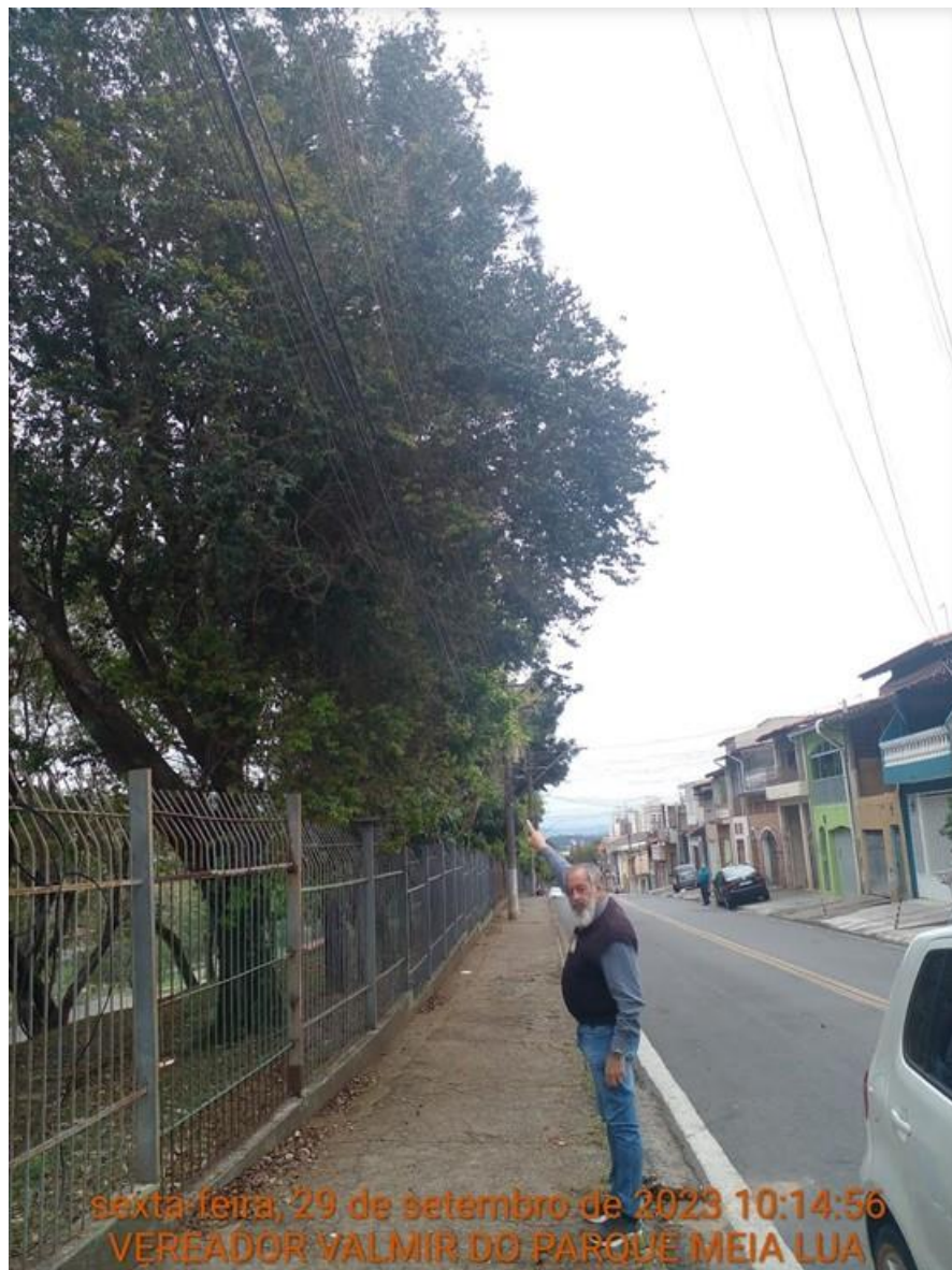
Fotos 2, 3 e 4: Rua dos Ibiscos, nº 525, no Parque Santo Antônio (EducaMais Parque Santo Antonio)